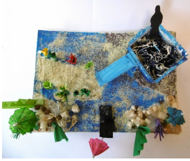
titre : La plus belle des plages conception : Lévana – Ismahan - Claire

Jardin humoristique où tous les accessoires de plage sont présents (sable, transat, parasol) mais dans lequel la plage en question n'est