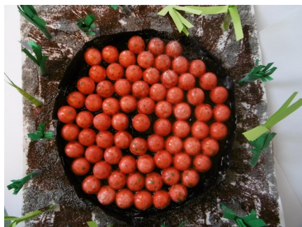
titre : Jardin des gourmandises conception : Adam

Jardin grotesque au sein duquel une gigantesque sculpture représente une tarte aux fraises. Aire de jeux ou espace de