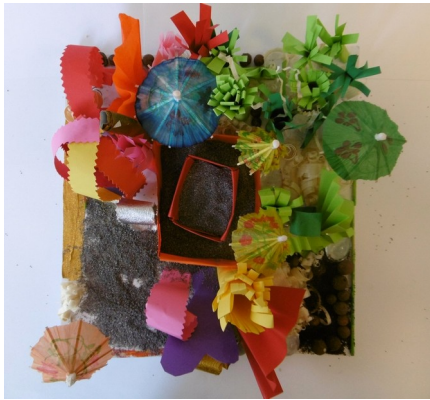
titre : La symphonie de la jungle conception : Menatalla

Jardin baroque et luxuriant au centre duquel siègent deux de minéraux. Un hymne à la terre enceint par un foisonnement végétal réparti entre teintes chaudes et froides.