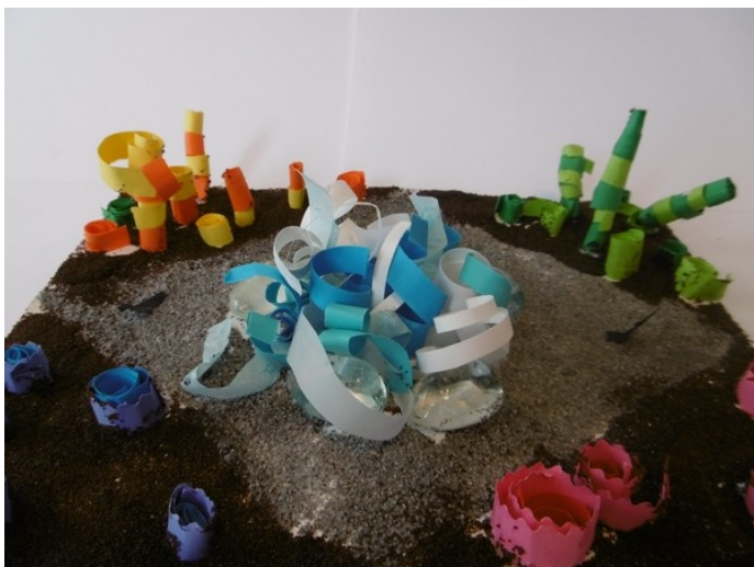
titre : Le jardin aux pétales de couleur conception : Aminata - Célia

Jardin très architecturé par une étude des matériaux de revêtement du sol qui scinde l'espace aquatique de la fontaine et les espaces cultivés. De la rencontre des végétaux des quatre couleurs naît la transparence de