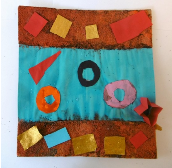
titre : Au soleil conception : Isra – Inès

Jardin géométrique de détente aux abords d'un cours d'eau structuré par les rectangles des serviettes de bain et les bouées.