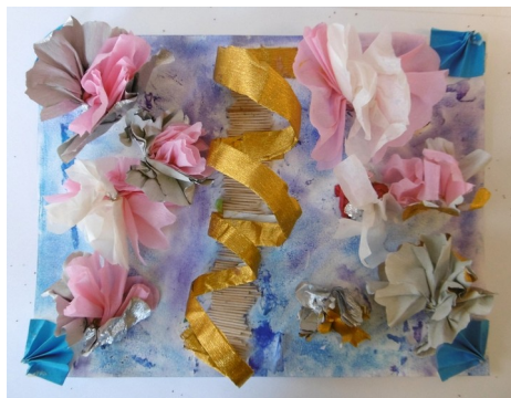
titre : Floraison du ciel étoilé conception : Laure

Jardin de promenade poétique au sein d'un parterre de