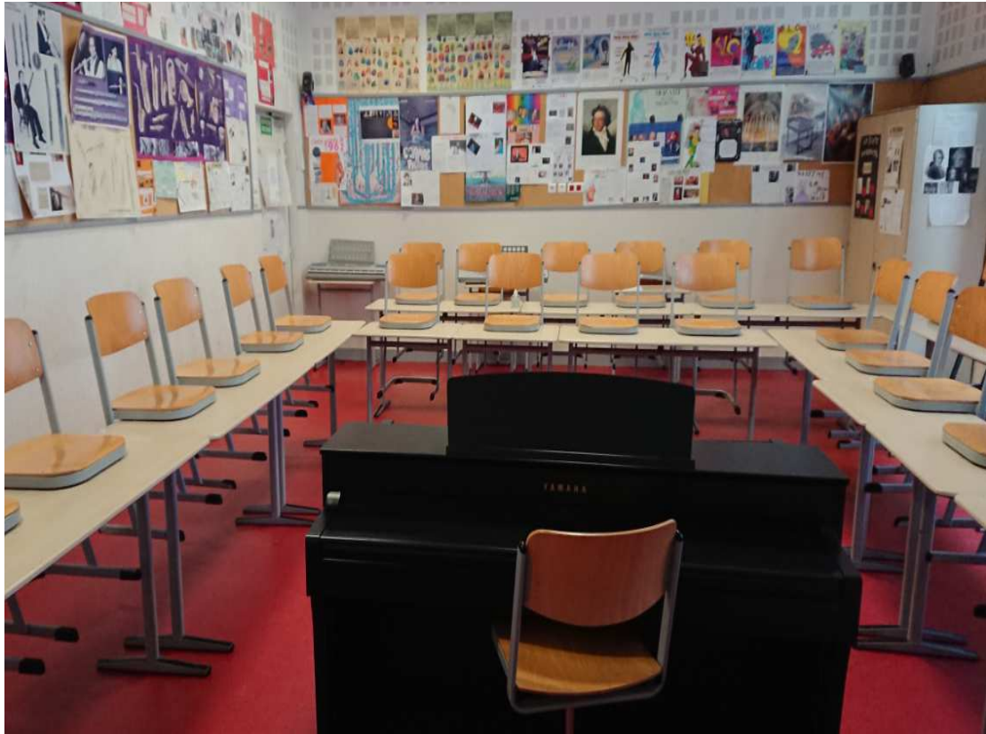
La salle de musique : C.21

Elle est équipée d'une sonorisation 5.1 (comme au cinéma !) avec un TNI et d'un piano numérique.